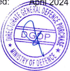
Colonel For Director General